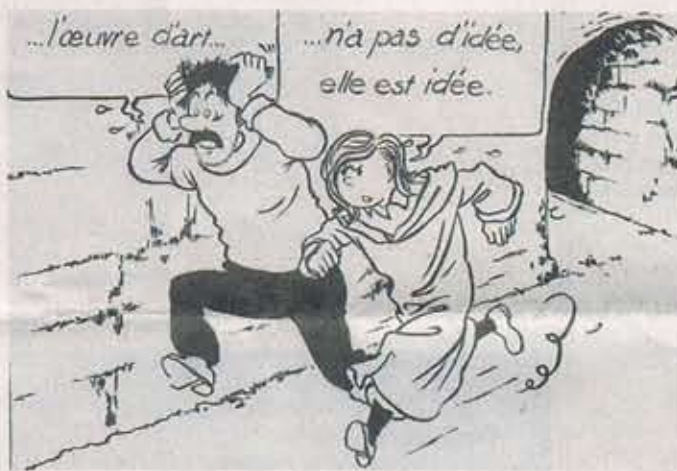
In jedem Heft findet sich eine Zeichnung aus der Serie «L'art n'a pas d'idée, elle est l'idée.»

Sinnvoll ist die Monografie auch deshalb, weil sie das Künst-